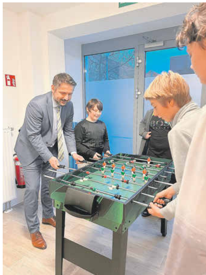
Tischkicker mit den Kindern der Tagesgruppe Eisenach

Die Besuche in Eisenach und Vacha waren nicht nur ein Zeichen der Anerkennung für die wertvolle Arbeit der Sozialpädagogischen Tagesgruppen, sondern auch eine Geste der Verbundenheit und Fürsorge - gerade in der Weihnachtszeit.