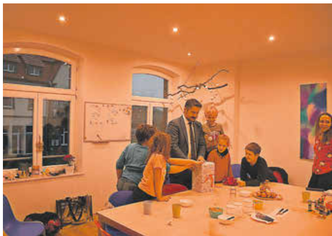
Auspacken der Geschenke in der Tagesgruppe Vacha